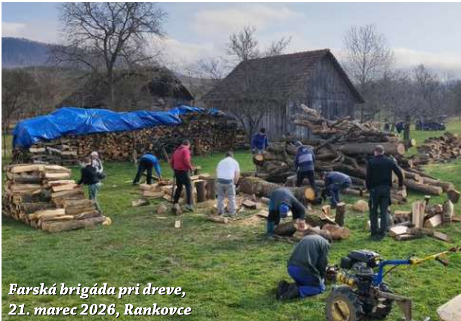
Farská brigáda pri dreve, 21. marec 2026, Rankovce