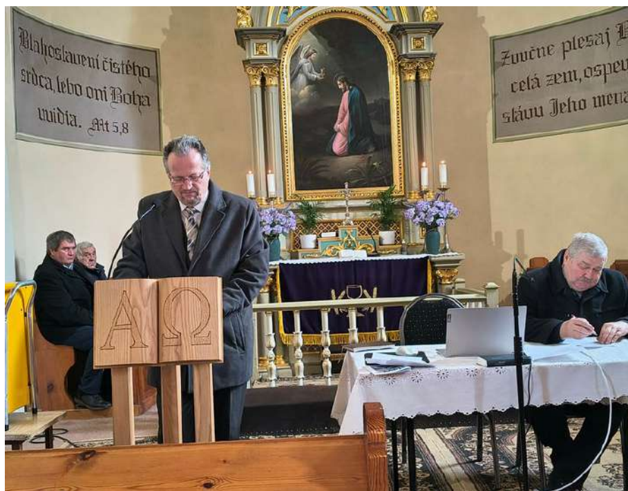
Zborový výročný konvent, 22. február 2026, Rankovce

31.12. – spoločné vítanie Nového roka, ROS, fara Rankovce ■