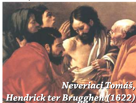
Neveriaci Tomáš, Hendrick ter Brugghen (1622)

Pán Ježiš teda Tomáša karhal presne v tom význame, ako sa to zaužívalo – za žiadanie vidieť dôkaz "na vlastné oči". Veď to, že mu o Ježišovom vzkriesení povedali ostatní učeníci, mu malo stačiť. Aj my nachádzame mnoho dôkazov pre našu vieru v každodennom živote. A ako dôsledok tejto myšlienky, tiež nám to môže slúžiť ako dobrá inšpirácia byť takýmto dobrým "dôkazom" pre vieru aj ďalších ľudí. ■