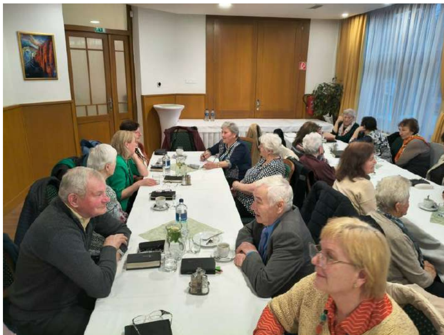
Pôstne stretnutie starších, 8. marec 2026, Herľany