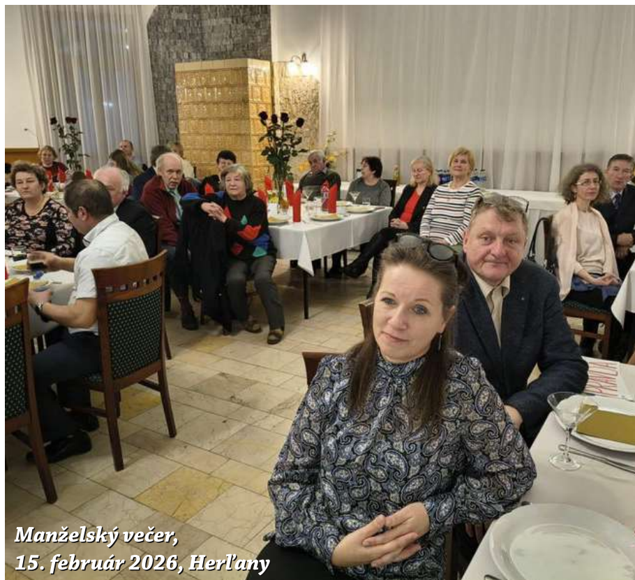
Manželský večer, 15. február 2026, Herľany

Človek, ktorý sa pýta po pravosti viery, by si mal položiť otázku: Žijem svoju vieru autenticky? Vidia iní vo mne Krista, alebo len moje názory? Vyznávať „Pravá viera je tá naša.“ znamená aj žiť tak, aby ľudia, ktorí sa s nami stretnú, zatúžili poznať Toho, v koho veríme. Naša viera je pravá nie preto, že ju vlastníme, ale preto, že ona vlastní nás, lebo patríme Kristovi, ktorý je Pravda, Cesta i Život. ■