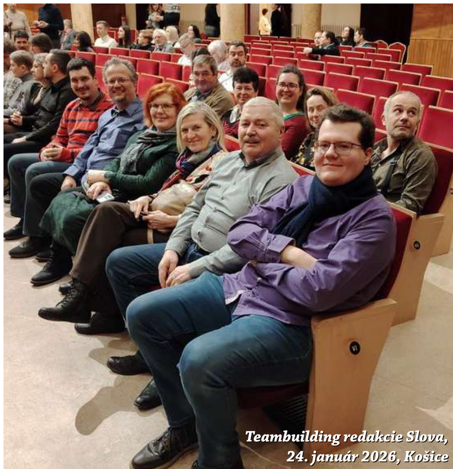
Teambuilding redakcie Slova, 24. január 2026, Košice

Nádeje a túžby tejto generácie zastavili dejinné udalosti. A predsa, odkaz nádeje posledných štyroch spomenutých presahuje dianie tohto sveta a odkazuje na lepšiu budúcnosť, ktorú nezničia ani hlad, ani kríza, ani vojna. Žime týmto odkazom aj my! ■