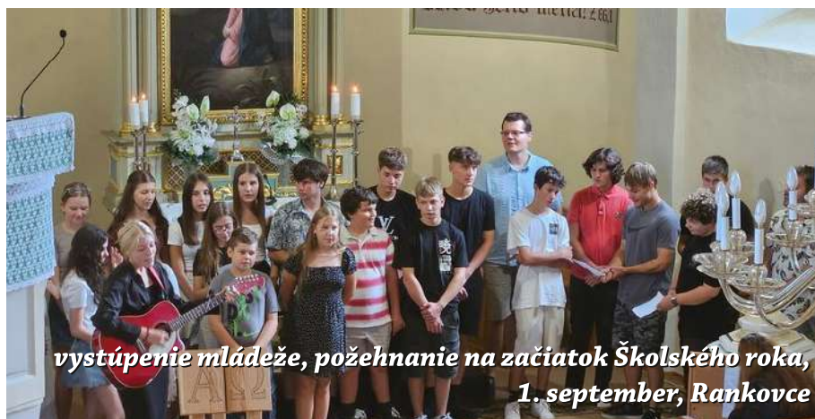
vystúpenie mládeže, požehnanie na začiatok Školského roka, 1. september, Rankovce