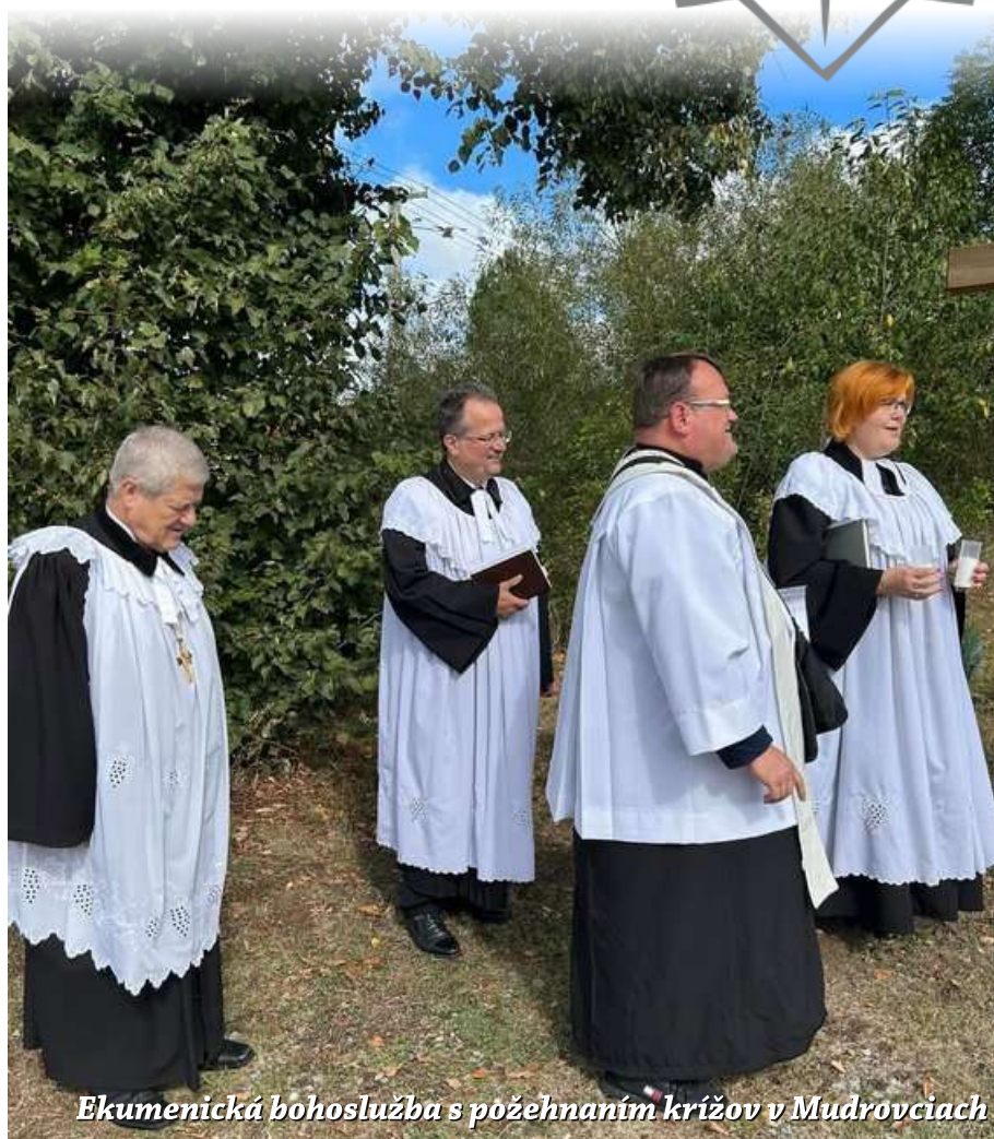
Ekumenická bohoslužba s požehnaním krížov v Mudrovciach