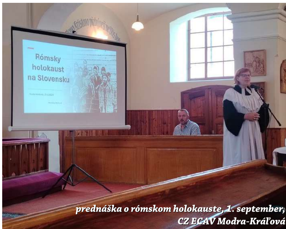
prednáška o rómskom holokauste, 1. september, CZ ECAV Modra-Kráľová