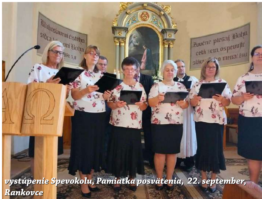
vystúpenie Spevokolu, Pamiatka posvätenia, 22. september, Rankovce

Táto diskusia dvoch veľikánov svojej doby posúvala reformáciu do svojich hĺbok, odkiaľ cirkev čerpá vzácne hodnoty dosiaľ. ■