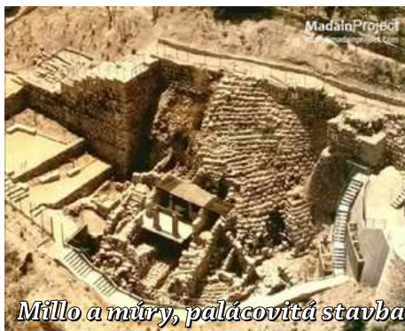
Millo a múry, palácovitá stavba