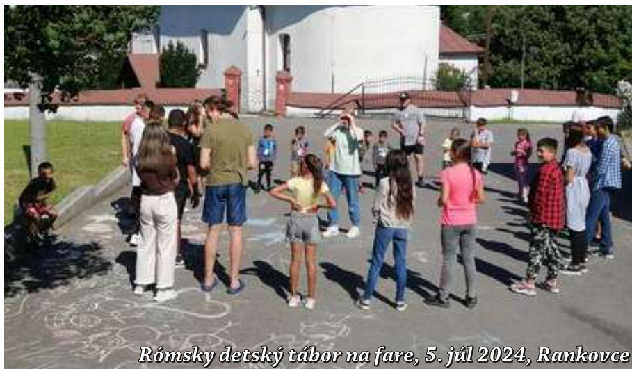
Rómsky detský tábor na fare, 5. júl 2024, Rankovce

Pri Sláve liturgie stojí otočený tvárou k oltáru a zbor odpovedá postojácky buď anjelskou odpoveďou „Pokoj ľuďom dobrej vôle,“ alebo vo výročných slávnosti celou piesňou. ■