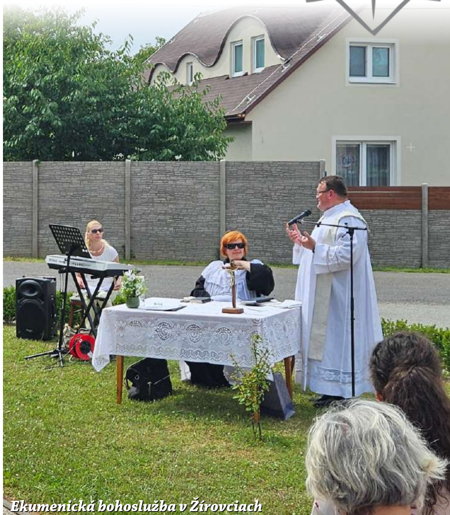
Ekumenická bohoslužba v Žirovciach