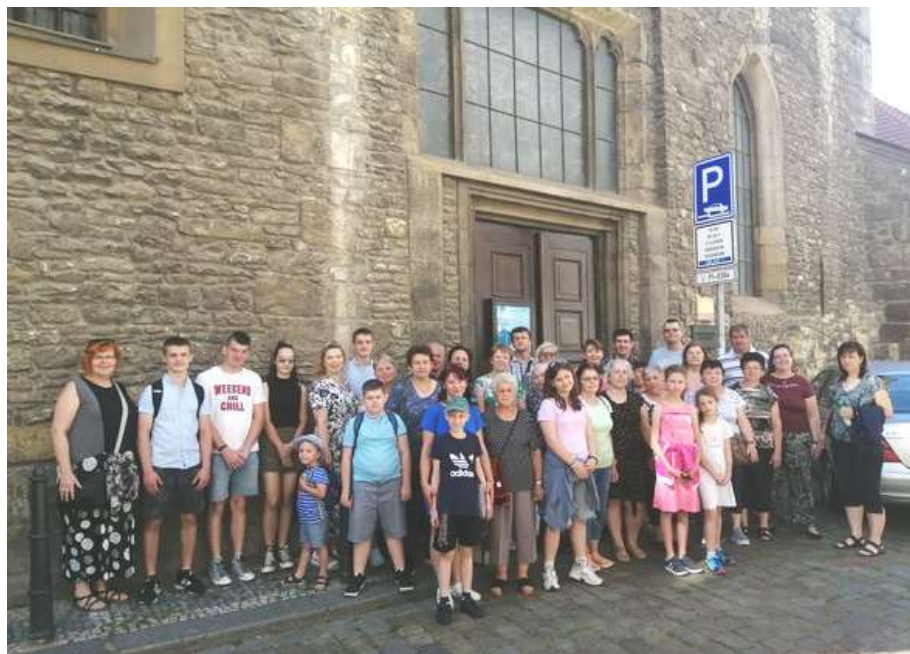
Spoločná fotka pred kostolom slovenského evanjelického zboru, 23. jún 2024, Praha