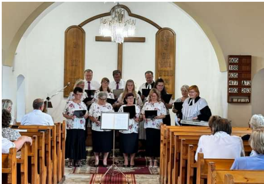
Pamiatka posvätenia chrámu, 21. júl 2024, Bačkovík