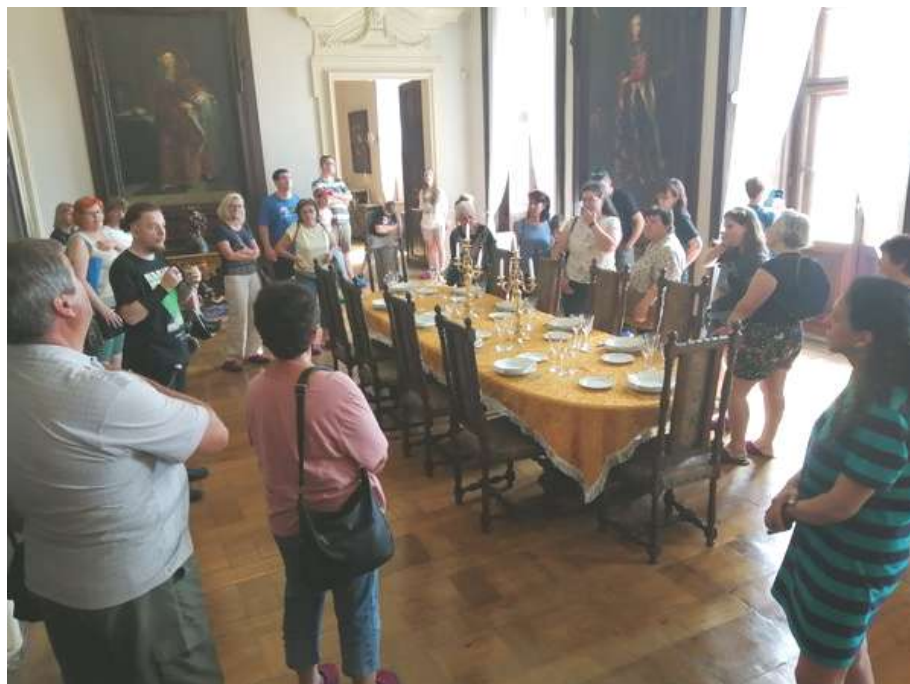
Zámok v Slavkove, 21. jún 2024, Slavkov u Brna

nej sme už pokračovali dobrým tempom do Prahy. Dorazili sme tam za slabšieho dažďa okolo 19:30, no to bol posledný náznak nie úplne priaznivého počasia za celý víkend. Ako ubytovanie počas výletu nám poslužil Hostel Dakura na Prahe 6. Osobne som bol milo prekvapený aj kvalitou, aj excelentnou polohou ubytovania, aj keď sme asi neboli úplne štandardní hostia, čo sa prejavilo teraz s odstupom času vtipnou "výmenou", keď sme zjavne v sobotu ráno pri rannom stúšení a zaspievaní piesní nechtiac zobudili pár iných hostí. To sa nám podobne neúmyselne vrátilo