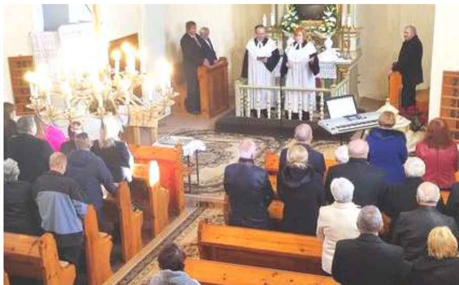
Zlatá confirmácia, 20. október, Rankovce

To dôležité je, že strážnici nepochybovali o tom, že nové ráno príde. To bola ich nádej. S rovnakou vážnosťou máme aj my, veriaci ľudia, hľadiť do budúcnosti a tešiť sa na príchod nového rána, ktoré príde s druhým príchodom Pána Ježiša Krista a ukončí všetku bolesť a nebezpečenstvá hriechu a smútok Božích detí premení na radosť. ■