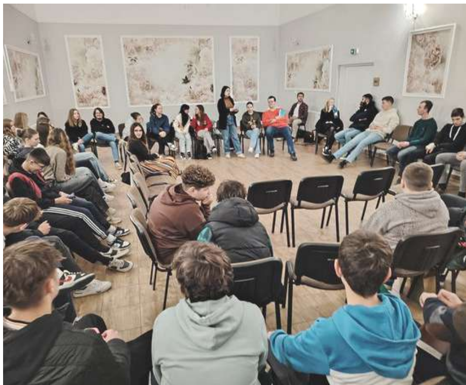
Stretnutie mládeži z Rankoviec, Budimíra, Obišoviec a Opinej, 26. október, Čakanovce

Po poslednej revízii v roku 1996 ostal v programe liturgie iba jeden pozdrav (lat. salutatio – v preklade: želanie spásy) po úvode služieb Božích, končiacom slávou, keď sa liturg (okrem úvodného privítania) po prvýkrát obracia k ľuďom. Vzhľadom na iný dôraz pozdravu v našej cirkvi než v rímskej omši je však v súčasnosti duplikáciou toho, čo sa deje hneď v úvode služieb Božích pri privítaní, keď je celkom prirodzené, že sa liturg pozdraví s prítomnými. ■