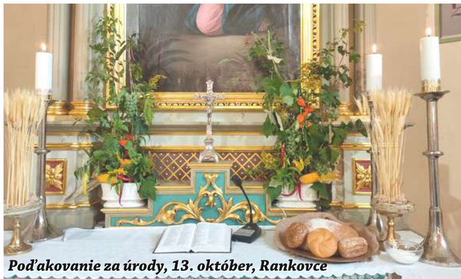
Pod'akovanie za úrody, 13. október, Rankovce

"Na Vianoce sa najviac teším na deti z besiedky na Štedrý večer. Bude to skvelé, keď uvidím všetky deti vystupovať a spievať. Okrem toho sa teším na čas s rodinou, keď si spolu sadneme alebo zahráme spoločenské hry. Samozrejme, aj na darčeky a vianočné jedlo, to je vždy veľký zážitok!" ■