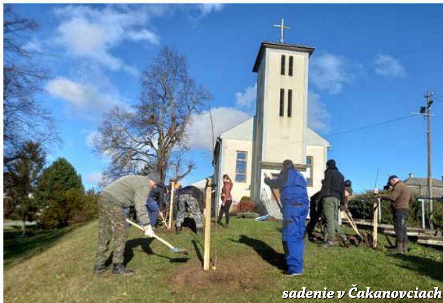
sadenie v Čakanovciach

V novembri už prebiehali v plnom prúde prípravné práce a propagačné aktivity. V týždni pred výsadbou boli spravené výkopy bagrom na vopred vybraných miestach a v sobotu 30. novembra sme už vysádzali stromčeky. Okolo ciest v Boli-