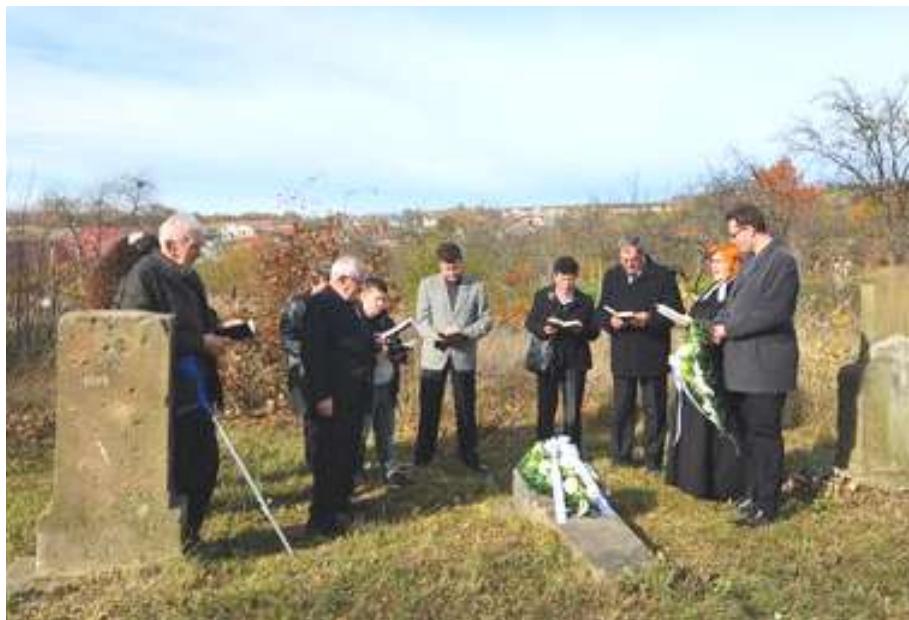
položenie kvetov pri hrobch farárov pochovaných v Rankovciach, 3. november, Rankovce

stve. Pán Boh nám aj skrze obyčajné plienky pripomína, že Boh nám chce dať večné rúcho. Si pripravený stretnúť sa s Ním? Dnes sa nám Ježiš zvestuje ako dieťa zavinuté do plienok, zavinuté do lásky a starostlivosti, aby dokonalú lásku a starostlivosť o náš časný i večný život preukázal nám všetkým. Si pripravený stretnúť sa s Ním? Si pripravený odhaliť svoju hanbu a obliecť si Kristovu spravodlivosť z milosti? Dnes večer bude plný rôznych darčiekov. Prajem vám, aby ste našli aj Ježiša Krista, ktorý vás prijíma s láskou a starostlivosťou a oblieka vás do svojej spravodlivosť. Toto je nevýčísľiteľný dar bez ktorého by Vianoce neboli. Amen. ■