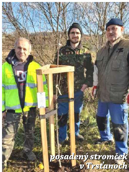
posadený stromček v Trstánoch

ského pralesa, naše obce už tak jednoduchú výhovorku neposkytujú. Modlime sa za to, ako vieme slúžiť a pomáhať, ako priložiť ruku k dobrým veciam alebo pomôcť svojim časom, peniazmi, či inou podporou k ochrane a zveladeniu nášho okolia.