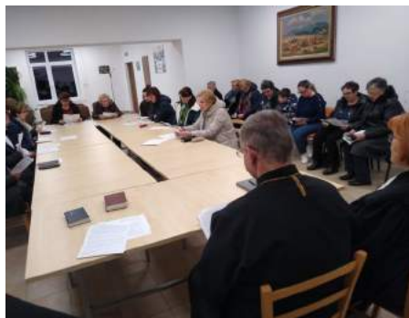
pôstny ekumenický večer Herľany

Po celozborovom konvente s voľbou novej zostavy nášho zborového presbyterstva sme sa pustili v našom spoločenstve do najrôznejších aktivít, ktoré – boli mnohé požehnané, niektoré sme však aj museli zrušiť (stretnutie seniorov). Tešíme sa z pravidelných stretávaní sa detí na besiedkach (Rankovce aj Boliarov), finišujúcich konfirmandov, mládeže s tímom vedúcich a pravidelnou chlapčenskou skupinkou, rodinkami, spevokolom, online stretávaním sa žien a tiež máme radosť aj z besiedky a mládeže v rómskej misii. Ďakujeme všetkým, ktorí sa počas pôstu zapojili do čítania pašií, ale aj všetkým, ktorí sa akokoľvek postavili do služby v našom spoločenstve!