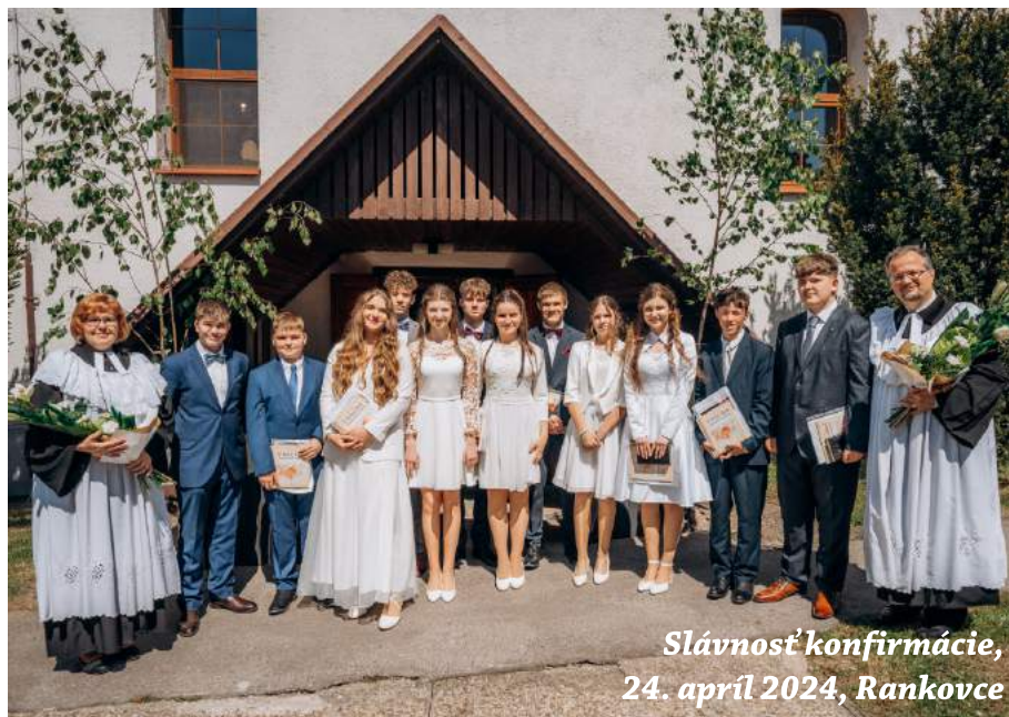
Slávnosť konfirmácie, 24. apríl 2024, Rankovce

urobí.“ Pavol tiež píše cirkevnému zboru v Kolosách: „...lebo sme počuli o vašej viere v Kristovi Ježišovi a o láske, ktorú máte ku všetkým svätým pre nádej, pripravenú vám v nebesiach. Počuli ste o nej už skôr v slove pravdy evanjelia, ktoré je medzi vami, ako aj na celom svete prináša ovocie a rastie aj vo vás odo dňa, keď ste počuli a poznali Božiu milosť v pravde.“ (Kol 1,5-6 Ekumenický preklad). Neskôr hovorí o Kristovi ako o „nádeji slávy“ (Kol 1,27), a potom zmieňuje skutočnosť tejto nádeje: „Keď sa zjaví Kristus, váš život, vtedy sa aj vy spolu s ním zjavíte v sláve.“ (Kol 3,4 Ekumenický preklad). Tento oslávený stav bude dokonalé oddelenie od hriechu, úplné posvätenie,