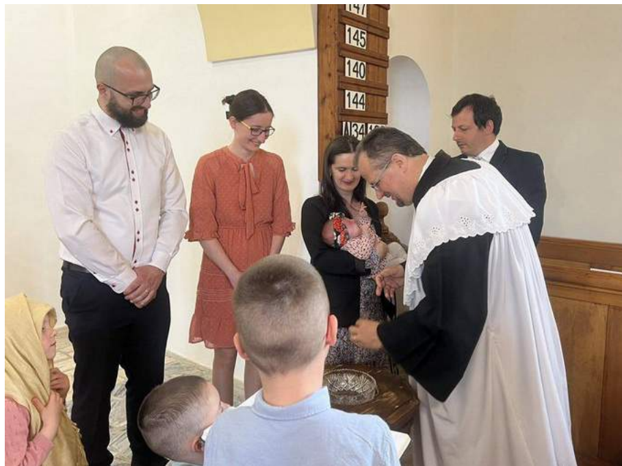
Krst v Bačkovíku

Biblia obsahuje ešte jeden význam slova „posvätenie“. Ap. Pavol sa v 1Tes 5,23 modlí: „ A sám Boh pokoja nech vás skrz-naskrz posväťí a pri príchode nášho Pána Ježiša Krista nech zachová vášho neporušeného ducha, dušu a telo bez úhony. Verný je Ten, ktorý vás povoláva; On to